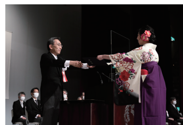
令和3年3月学位記授与式 2021年3月25日