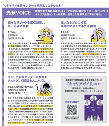
キャリア支援センターご案内 就職活動体験インタビュー(2022年度版)