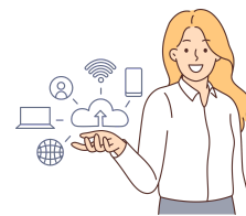
生命科学研究科 修士2年