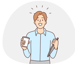
情報科学研究科 修士2年